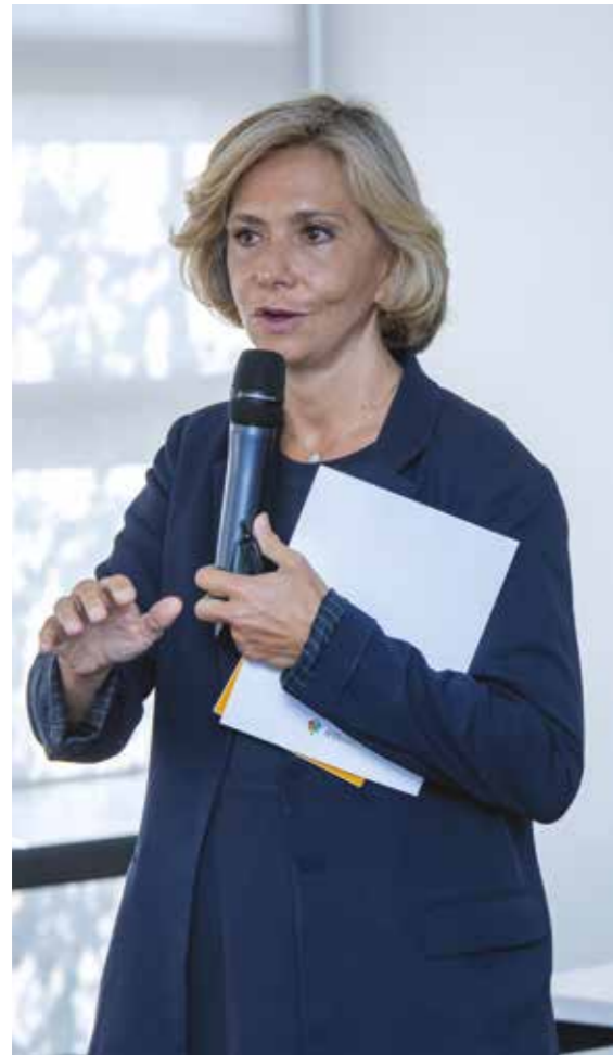
Valérie PECRESSE Présidente de la Région Ile-de-France 瓦莱丽·佩克莱斯: 法兰西岛大区主席