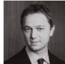
Maël de CALAN Conseiller départemental du Finistère 菲尼斯太尔(省)地方议员