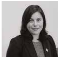
Anne-Laure CATTELOT Députée du Nord 法国北部大区议员