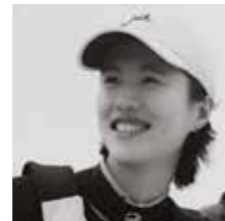
XU Lijia 徐莉佳 Skippeuse, Médaillée olympique Laser Radial femmes 奥运会女子单人艇金牌