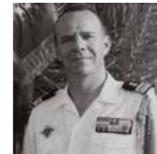
Arnaud GOUJON Colonel, Adjoint du bureau plans de l'État-major de l'Armée de Terre 上校, 法国陆军总参谋部办公 室副主任