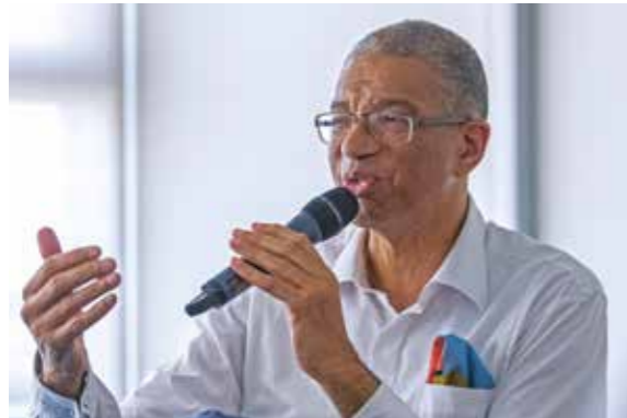
Lionel ZINSOU Économiste franco-bénois, Ancien Premier ministre du Bénin 利昂内尔·津苏：经济学家；贝宁共和国前总理