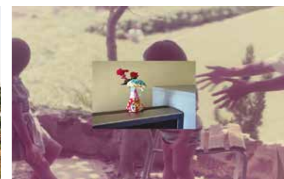
Kurt TONG, Panneaux publicitaires vides, 2017, Zhongshan.

唐景锋，《空白广告牌》，2017年，中山。