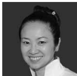
SHAN Sa Écrivain, Artiste Peintre 山飒 作家、画家